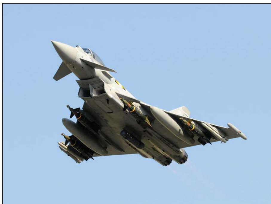
Avion Typhoon de la Royal Air Force Britannique