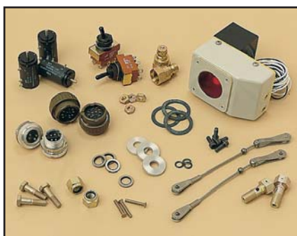
Divers composants pour un projet de modification/mise à jour de Repaircraft