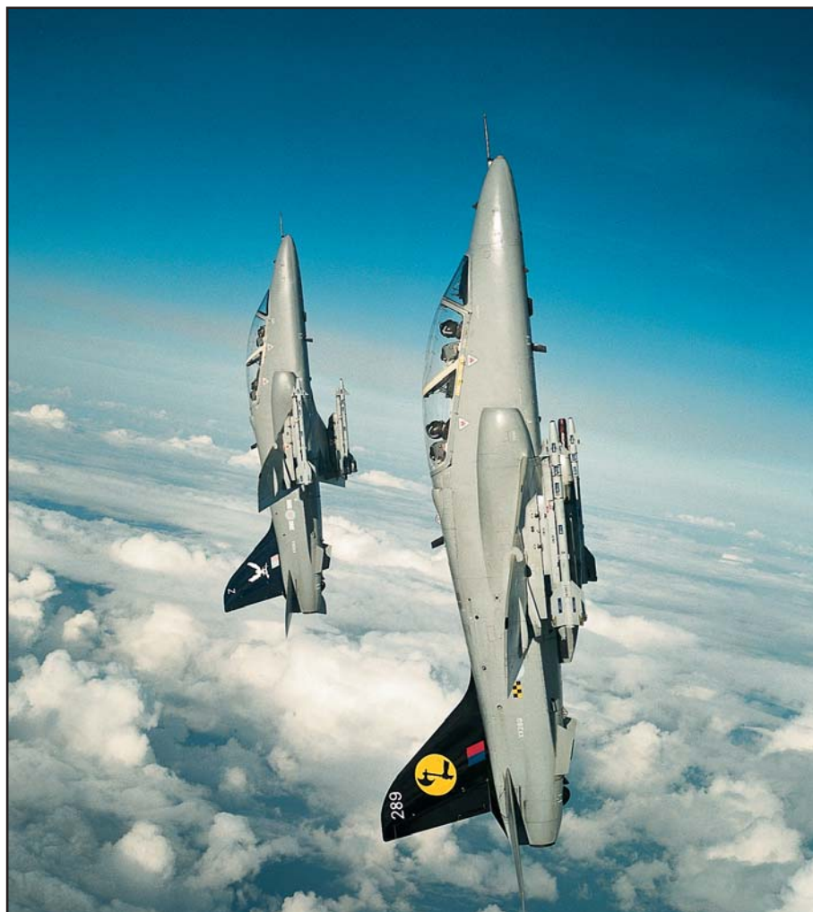
Avions Hawk de la Royal Air Force Britannique