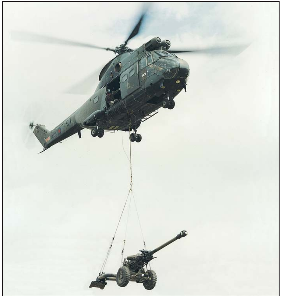
Canon de campagne de 105 mm transporté par un hélicoptère Puma