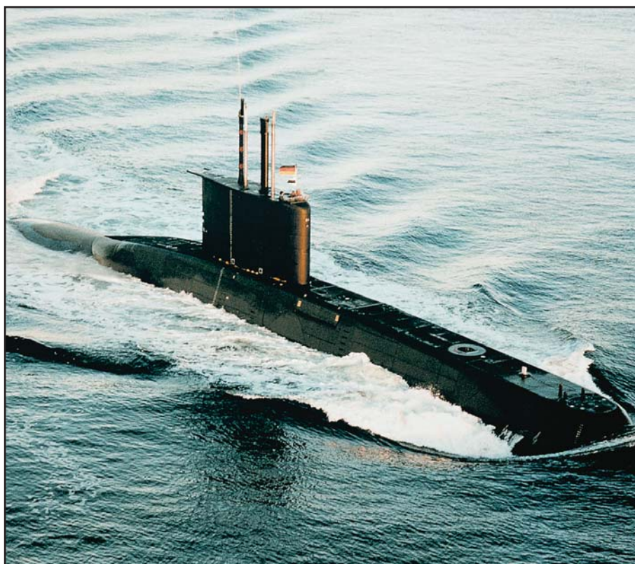
Le sous-marin de type 209