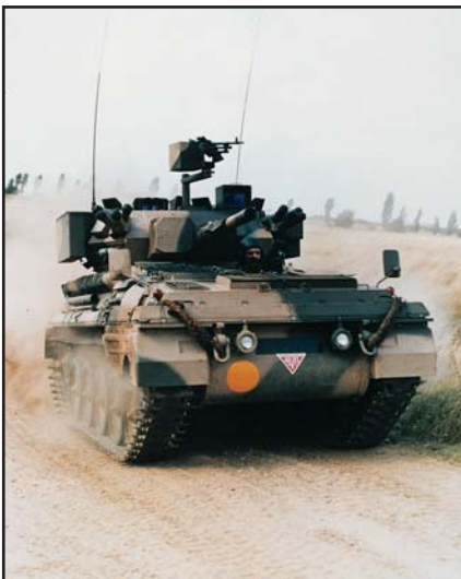
Char léger Scorpion