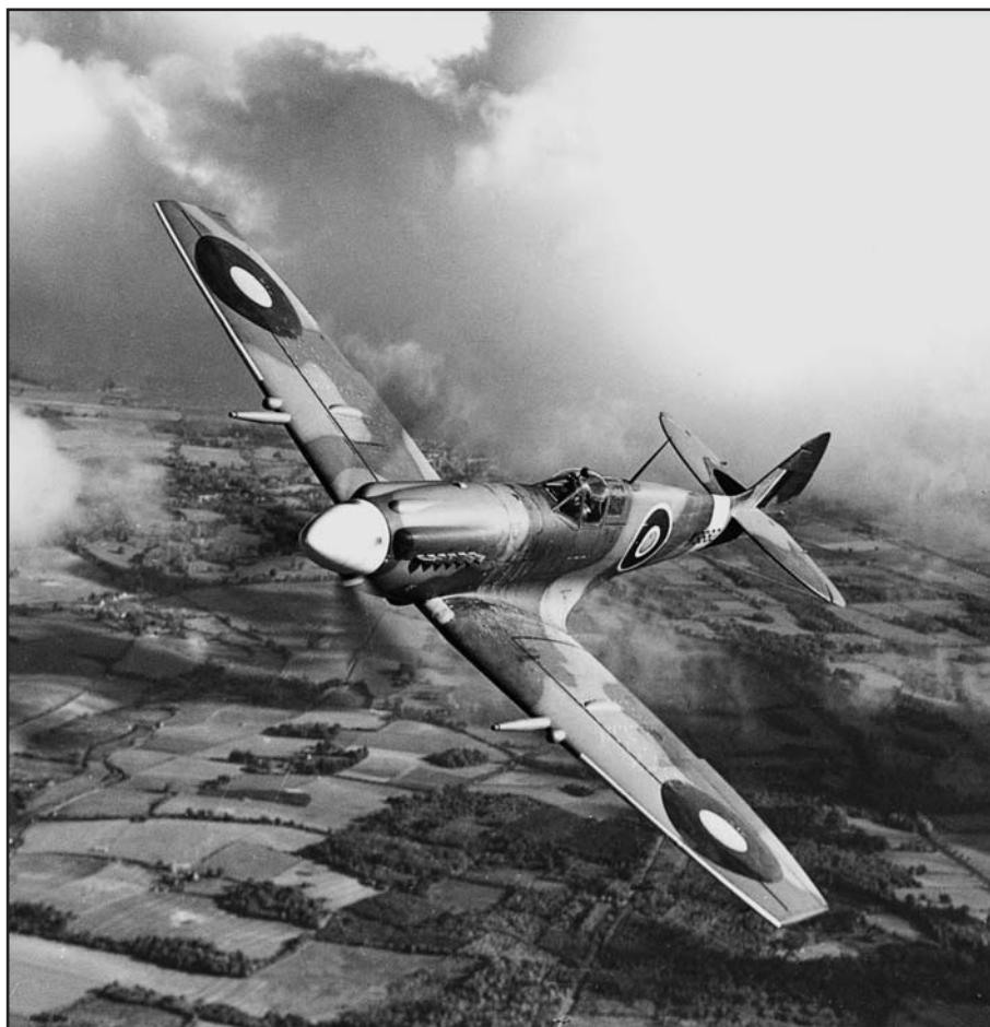
Un Spitfire MK XII maintenu par Repaircraft durant les années 40

En résumé, grâce aux efforts conjugués de nos chercheurs, ingénieurs, acheteurs et inspecteurs d'assurance qualité hautement qualifiés et expérimentés auxquels viennent s'ajouter un système de gestion et d'exploitation entièrement informatisé et intégré, nous sommes à même d'offrir un soutien total.