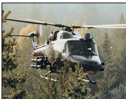
Hélicoptère Lynx armé de missiles TOW