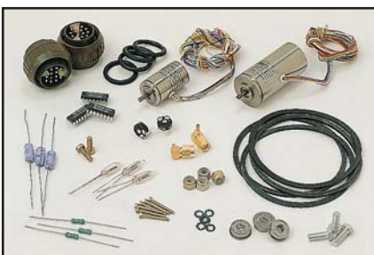
Elément d'un ensemble de pièces de rechange destinées au système de missiles Rapier