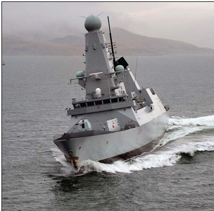
HMS Diamond, de la Royal Navy Britannique

Plaquettes destinées à un système informatisé d'enregistrement de données