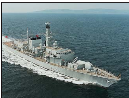
Frégate de type 23

Transformateurs remplis d'huile résistants aux chocs et divers composants électriques pour un projet d'entretien de radar naval