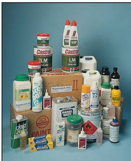
Peintures, produits d'étanchéité, adhésifs et lubrifiants etc. fournis par Repaircraft

Repaircraft fournit des pièces de rechange et des systèmes pour tous les types d'avions, hélicoptères, missiles, armements, équipement aéro-électronique, équipement de surveillance, matériel de support au sol, simulateurs de vol etc.