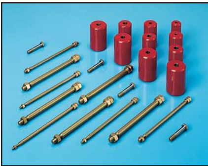
Kit d'entretien fabriqué par Repaircraft pour Fobusier de 155 mm

Repaircraft fournit des pièces de rechange et des systèmes pour tous les types de véhicules de combat, lance-missiles, obusiers, équipements de construction de ponts, transporteurs, camions, remorques, véhicules de servitude légers, équipement de ravitaillement, générateurs, équipement de transmission, équipement de surveillance etc.