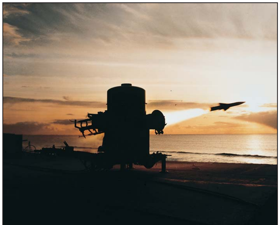
قاذفة صواريخ Rapier