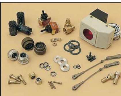
تشكيلة قطع لأحد مشاريع التعديل والتحديث قامت به Repaircraft