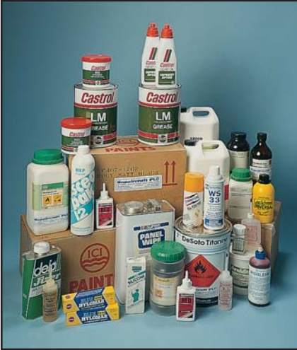
طلاءات ومواد مانعة للتسرب ومواد لاصقة وشحومات وخلافها زودتها Repaircraft

تزود Repaircraft قطع وأنظمة كاملة لجميع أنواع الطائرات والهليكوبتر والصواريخ والمعدات الحربية ومعدات الطيران ومعدات المراقبة ومعدات الدعم البري والمحاكيات الخاصة بالتدريب