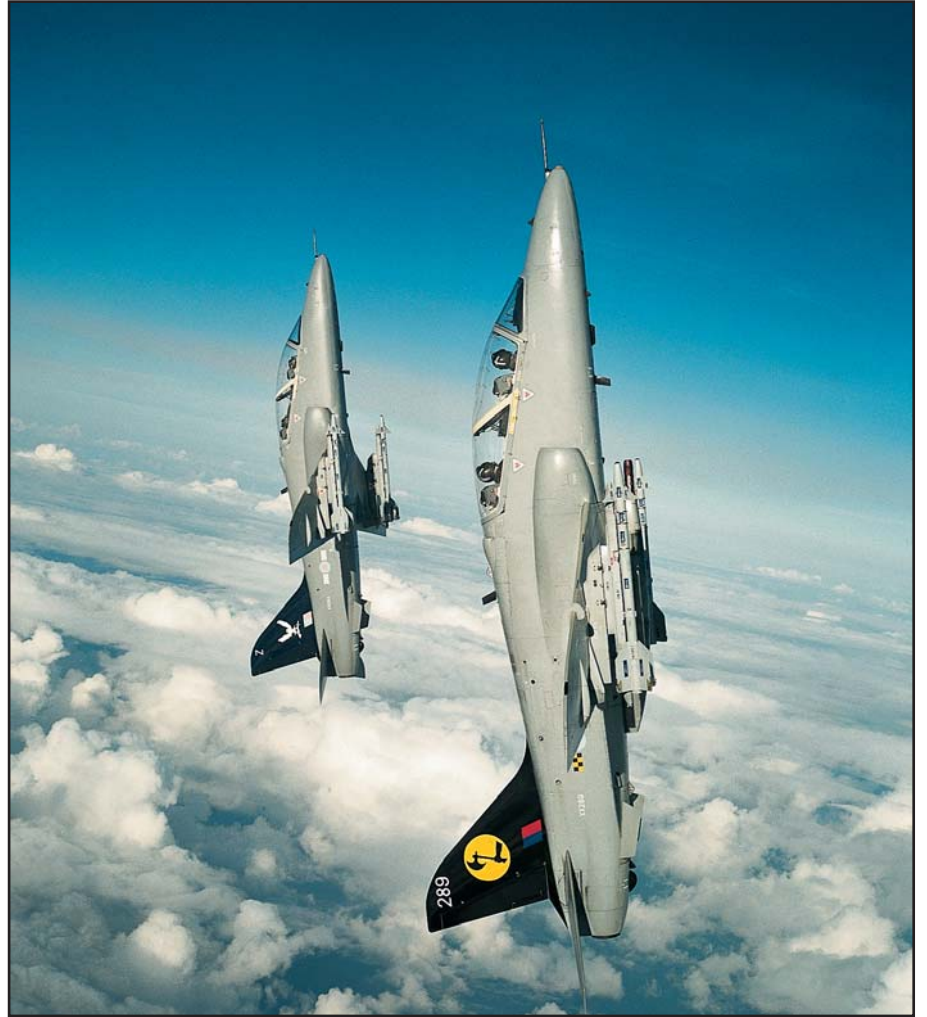
طائرة Hawk تابعة لسلاح الطيران الملكي البريطاني مع صواريخ Sidewinder