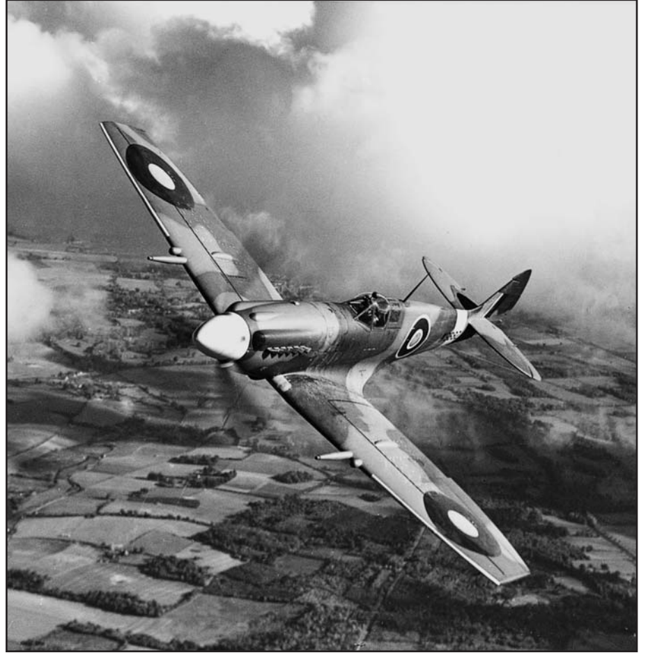
طائرة Spitfire MK XII مجهزة بقطع وأنظمة من Repaircraft في سنوات الأربعينات

وبإختصار فشركة Repaircraft تستطيع أن توفر دعماً شاملاً بفضل العاملين فيها من مهندسين وباحثين من ذوي الخبرة والتدريب العالي والموظفين المختصين في الشراء ومفتشي مراقبة الجودة الى جانب نظام حاسوب حديث ومتكامل للعمليات والإدارة.